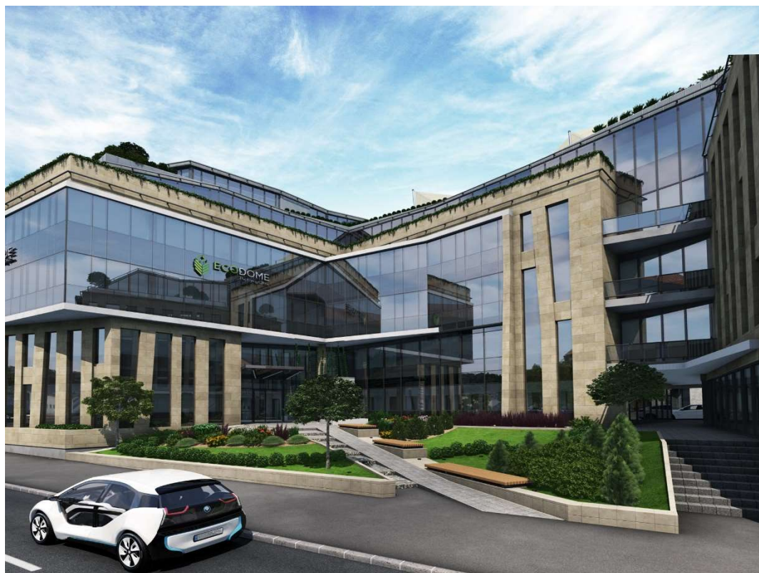
1. Kulcs-Soft új irodaháza 2018 – Ecodome irodaház

2018 HR szempontból is kiemelt eseménye, hogy bérlőként Budapest egyik legkorszerűbb, „legzöldebb” irodaházába az Ecodomeba költözünk, ami modern, élhető, inspiratív környezetet nyújt majd jelenlegi és jövőbeli munkatársaink részére. A helyszín már alkalmas lesz a nagy hagyományokkal rendelkező Kulcs-Akadémia saját helyszínén történő lebonyolítására is, ahol ügyfeleink a magasszínvonalú képzést már ergonomikus, modern környezetben kaphatják meg.